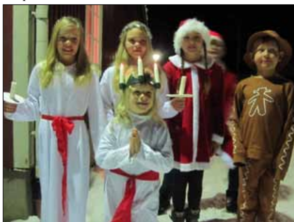
Ungdomssektionen bjöd Skinkracets deltagare på ett uppskattat lussetåg.

Tomten var på plats och delade ut godis.